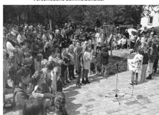
Eröffnung des Schulfestes