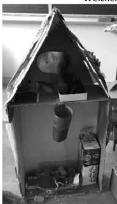
Upcycling- gebastelt aus „Müll“