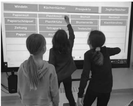
Welcher Müll gehört wohin?